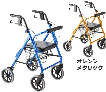
オレンジ メタリック