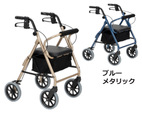
ブルー メタリック