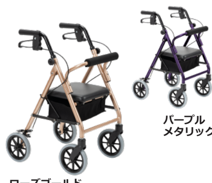
パープル メタリック