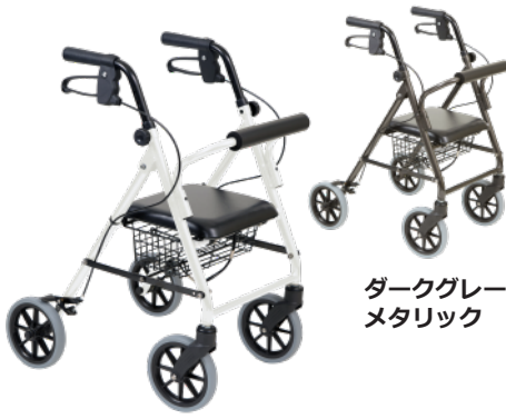
ダークグレー メタリック