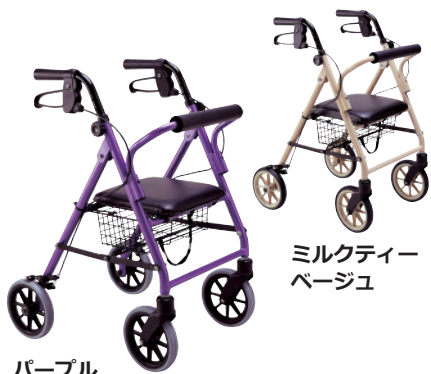
ミルクティー ベージュ